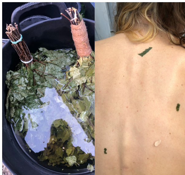
Banya Unlimited von Elena Malzewa